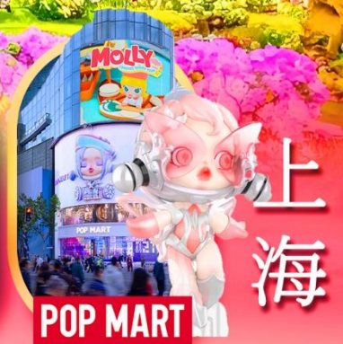
ช้อปปิ้งถนนหนางจิง