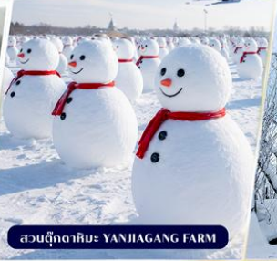
สวนฤดูหนาว: YANJIANG FARM