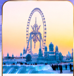
เทศกาลแกะสลักน้ำแข็ง Harbin Ice and Snow Festival