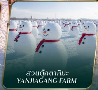
สวนตุ๊กตาหิมะ YANJIAGANG FARM