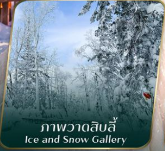
ภาพวาดสิบลี้ Ice and Snow Gallery

ตั๋วเครื่องบินออกเดินทาง ตั้งแต่ 15 วันขึ้นไป