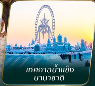
เทศกาลน้ำแข็ง นานาชาติ