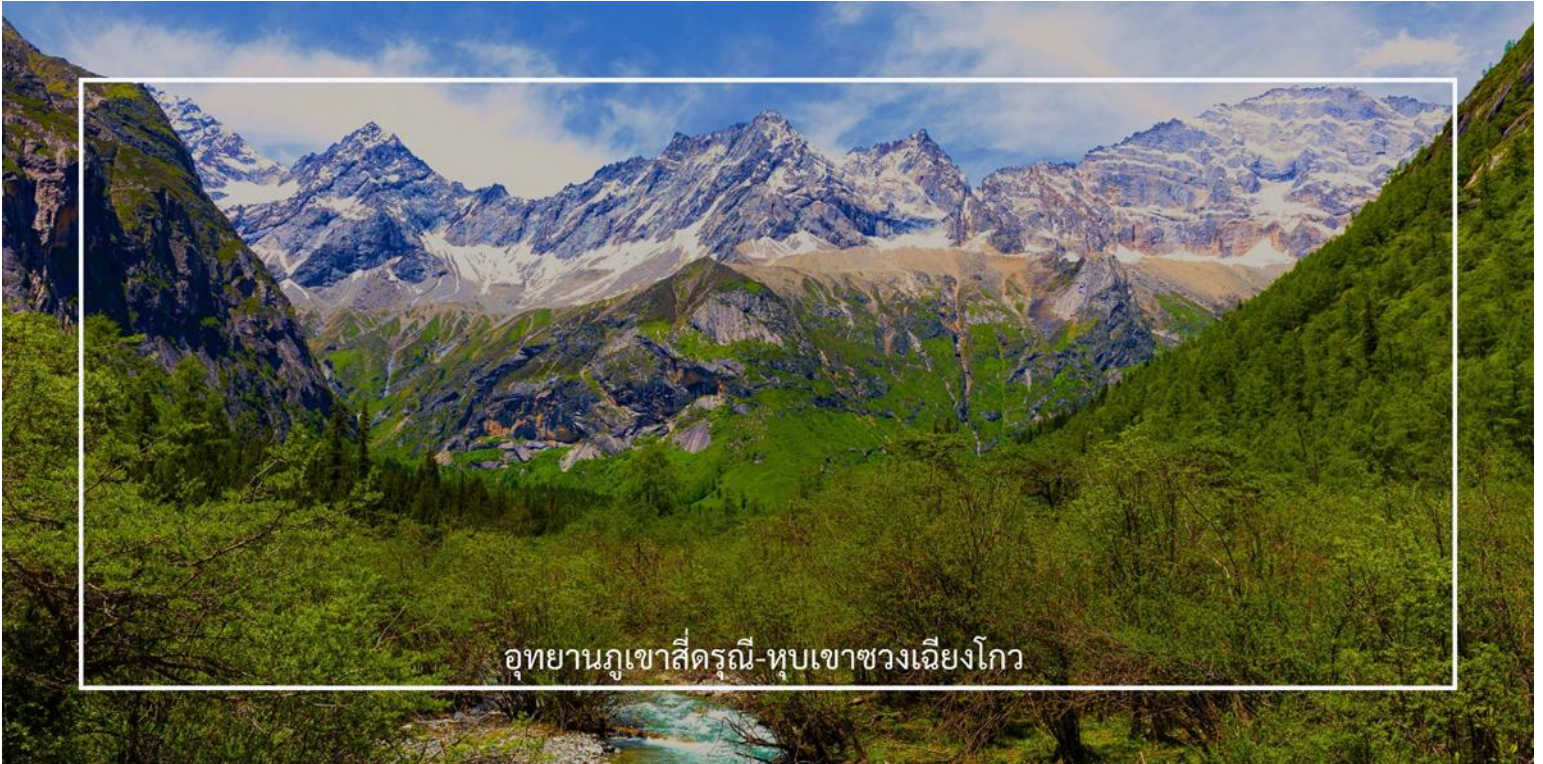
อุทยานภูเขาซีตฺรุณี-หุบเขาซวงเฉียวโกว

นำท่านชมเส้นทางไฮไลท์ หุบเขาซวงเฉียวโกว (Shuangqiaogou Valley) (รวมรถอุทยาน) เป็นหนึ่งในสถานที่ท่องเที่ยวที่สวยงามที่สุดของอุทยานภูเขาซีตฺรุณี เดินทางง่ายและสะดวกที่สุด เราจะเดินทางเข้าไปยังจุดที่ลึกที่สุด และค่อย ๆ นั่งรถเที่ยวออกมาตามจุดต่าง ๆ เส้นทางนี้รวมจุดสำคัญหลายอย่างไว้ด้วยกัน ทั้งภูเขาที่สูงตระหง่านและปกคลุมไปด้วยหิมะในฤดูหนาว พุ่มหญ้าเขียวขจีในฤดูใบไม้ผลิและฤดูร้อน หรือเห็นธารน้ำแข็งและทะเลสาบต่างๆ ทำให้คุณได้สัมผัสกับความงดงามของธรรมชาติในทุกฤดูกาลได้แบบ 360 องศา