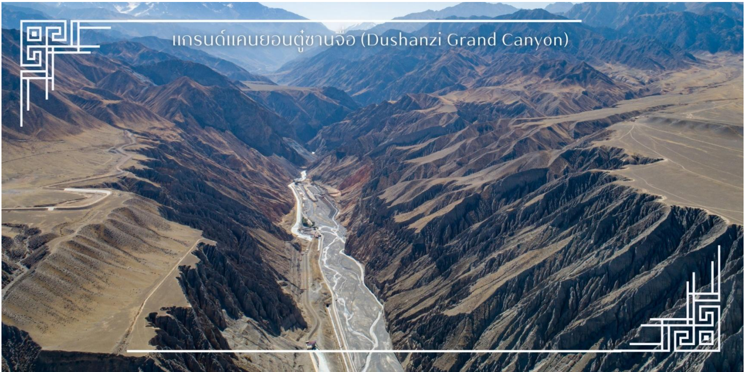
แกรนด์แคนยอนดูซานจื่อ (Dushanzi Grand Canyon)

เที่ยง บริการอาหารเที่ยง ณ ภัตตาคาร (มื้อที่2) นำท่านเดินทางสู่ เมืองโบล่่อ หรือ ป่อเอ่อเล่อ(Bole) (ใช้เวลาเดินทางประมาณ 3.30 ชั่วโมง) ตั้งอยู่ทางตอนเหนือของเขตปกครองตนเองซินเจียงอุยกูร์ เมืองศูนย์กลางของเขตปกครองตนเองมองโกลบอร์ตالا โดดเด่นด้วยภูมิประเทศที่โอบล้อมด้วยทุ่งหญ้ากว้างใหญ่ ทะเลสาบใสสะอาด และแนวเทือกเขาสูงตระหง่าน