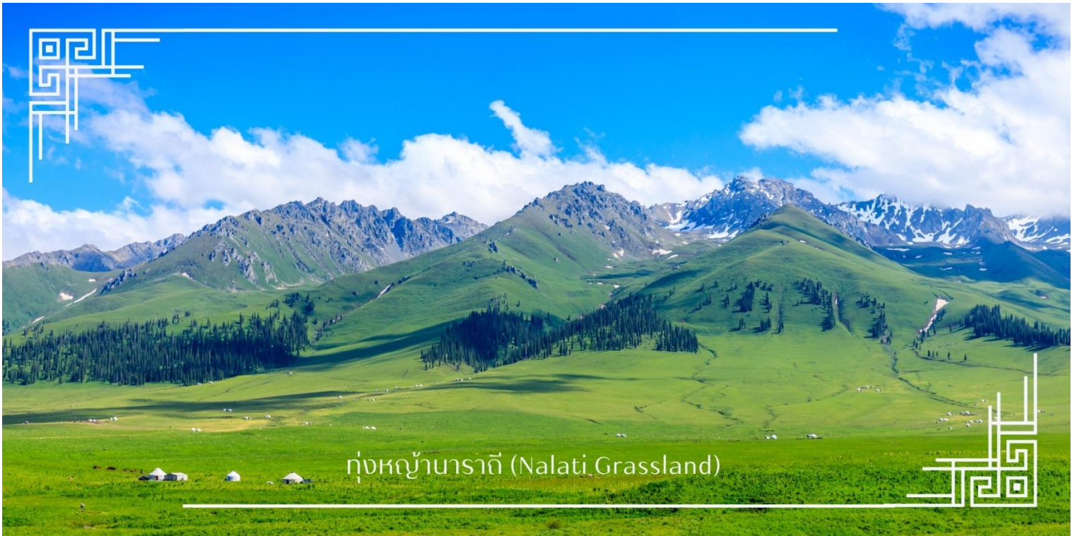
ทุ่งหญ้าบาราถิ (Nalati Grassland)