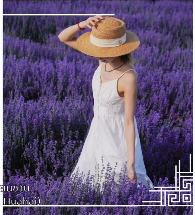
ทุ่งดอกไม้เทียนซาน (Yili Tianshan Huahai)

จากนั้นนำท่านสู่เมืองนาราลี (ใช้เวลาเดินทางประมาณ 3 ชั่วโมง)