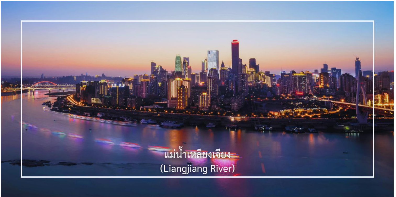
แม่น้ำเหลียงเจียง (Liangjiang River)

เดินทางเข้าโรงแรมที่พัก Licheng hotel Guanyinqiao shop ระดับ 4 ดาวหรือเทียบเท่า