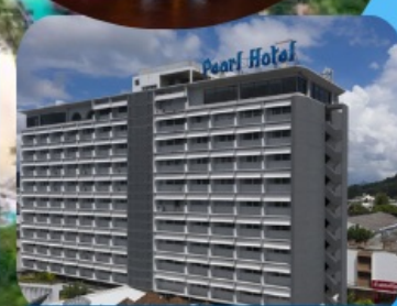
โรงแรมเพิร์ล