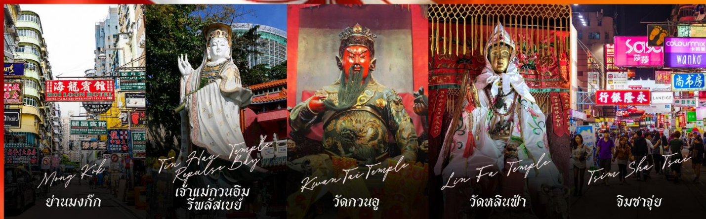
Mong Kok ย่านมงก๊ก

รายการทัวร์ข้างต้นอาจมีการปรับเปลี่ยนเพื่อความเหมาะสม