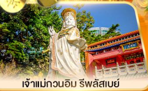
เจ้าแม่กวนอิม ธิพลสเบย์