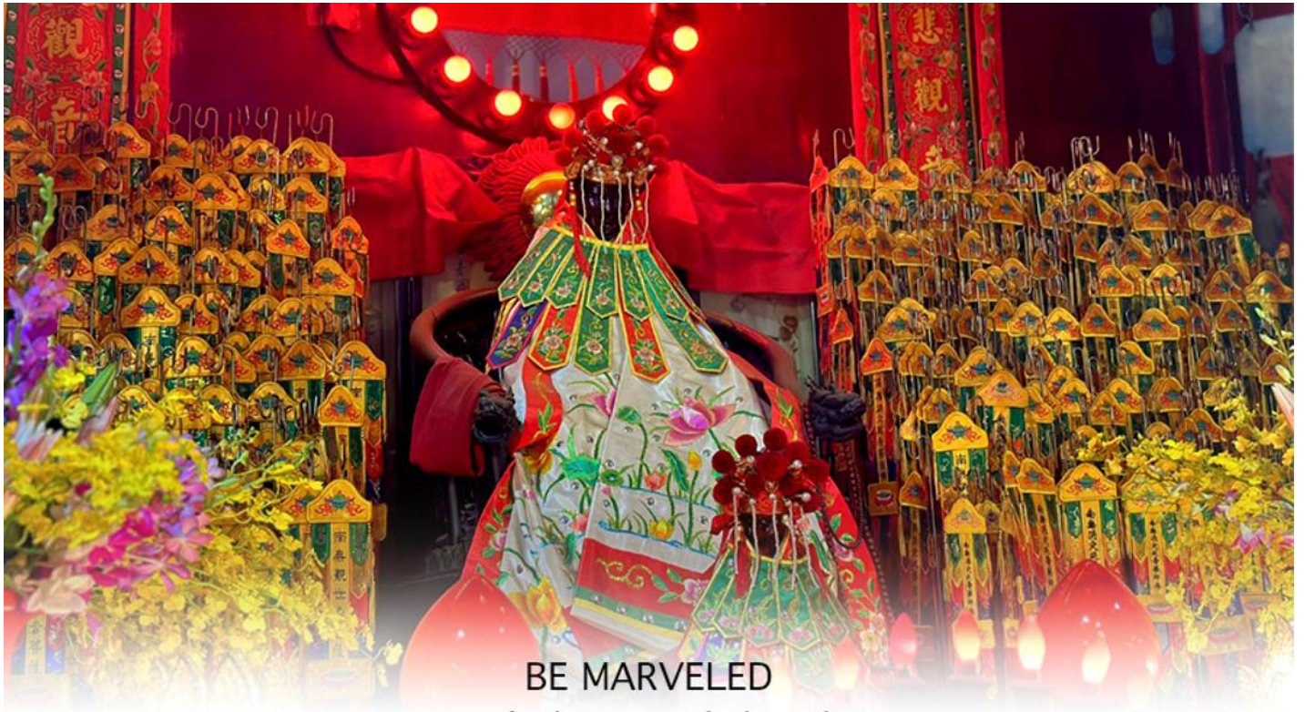
BE MARVELED วัดเจ้าแม่กวนอิมฮวงอ่า (ยิมจิน)

ให้เดินทางกลับไปกราบไหว้ และขอบคุณเจ้าแม่กวนอิมอีกครั้ง โดยเตรียมชุดไหว้และกระดาษาเงินกระดาษาทองที่เป็นเหมือนเงินที่เรานำมาคืน เป็นการไหว้เพื่อคืนเงินเจ้าแม่กวนอิมนั่นเอง