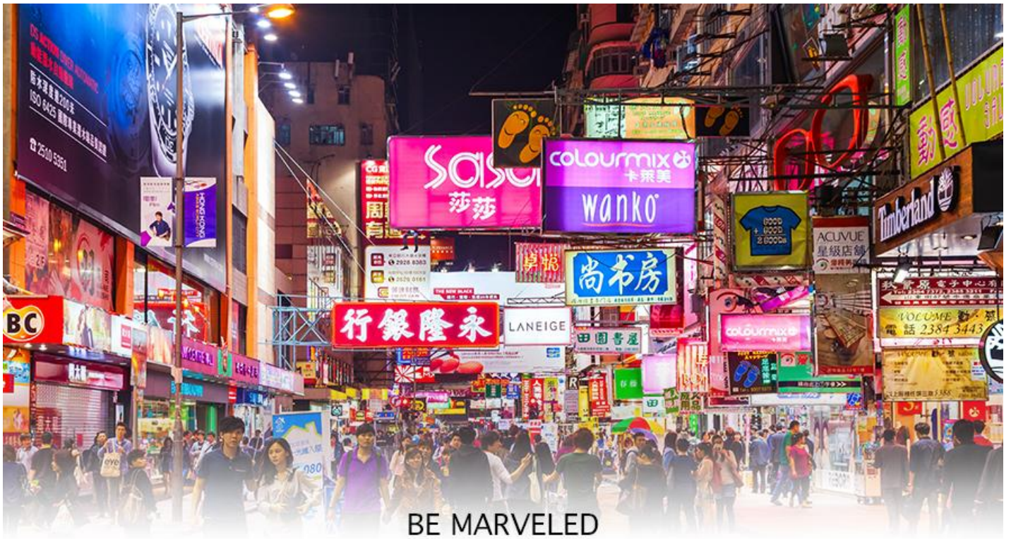
BE MARVELED TSIM SHA TSUI