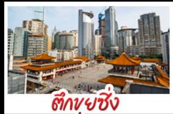
ตึกขุยซิ่ง

พระแกะสลักหินต้าจู้ - หลุมฟ้าสะพานสวรรค์ - เขานางฟ้า ตึกขุยซิ่ง - ตึกตะเกียบ หมู่บ้านโบราณฉือซีไห่