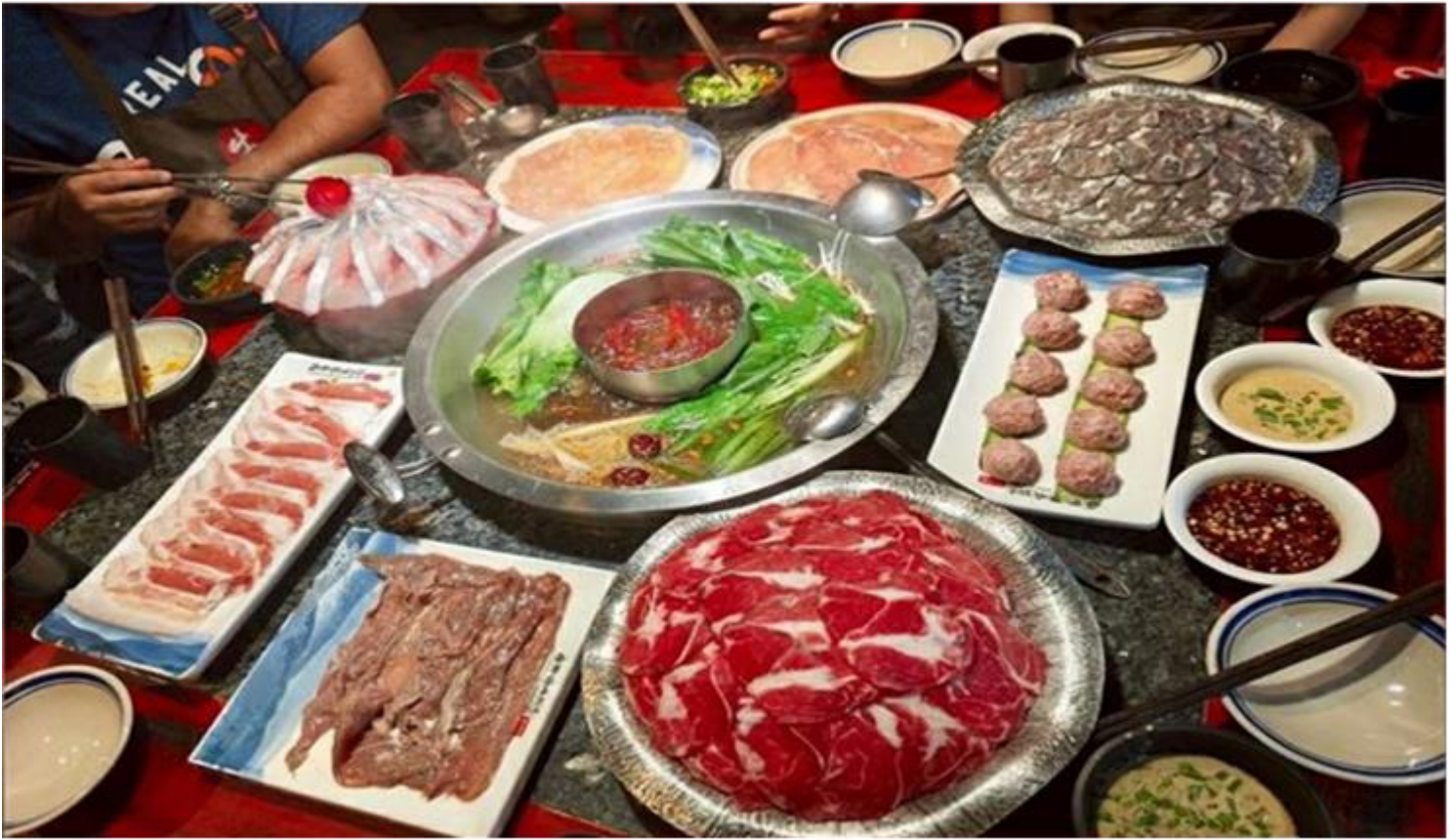
ค่ำ รับประทานอาหารค่ำ ณ ภัตตาคาร (เมื่อที่ 12) *เมนูพิเศษสุกี้หมอล่าเสวน

อิสระช้อปปิ้ง ถนนไท่กุ๋หลี่ หนึ่งในแหล่งช้อปปิ้งและไลฟ์สไตล์ระดับพรีเมียม ตั้งอยู่ใจกลางเมืองเฉิงตู โดดเด่นด้วยการออกแบบสถาปัตยกรรมที่ผสมผสานระหว่างความโมเดิร์นและวัฒนธรรมจีนดั้งเดิม มีทั้งแบรนด์แฟชั่นระดับโลกอย่าง Gucci, Chanel, Balenciaga รวมถึงร้านค้าไลฟ์สไตล์และแฟชั่นท้องถิ่น อาหารท้องถิ่นและคาเฟ่นานาชาติสวยๆ ที่เหมาะสำหรับการนั่งพักผ่อน