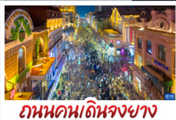
ถนนคนเดินจงยาง