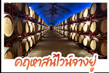
คฤหาสน์ไวน์างงยู