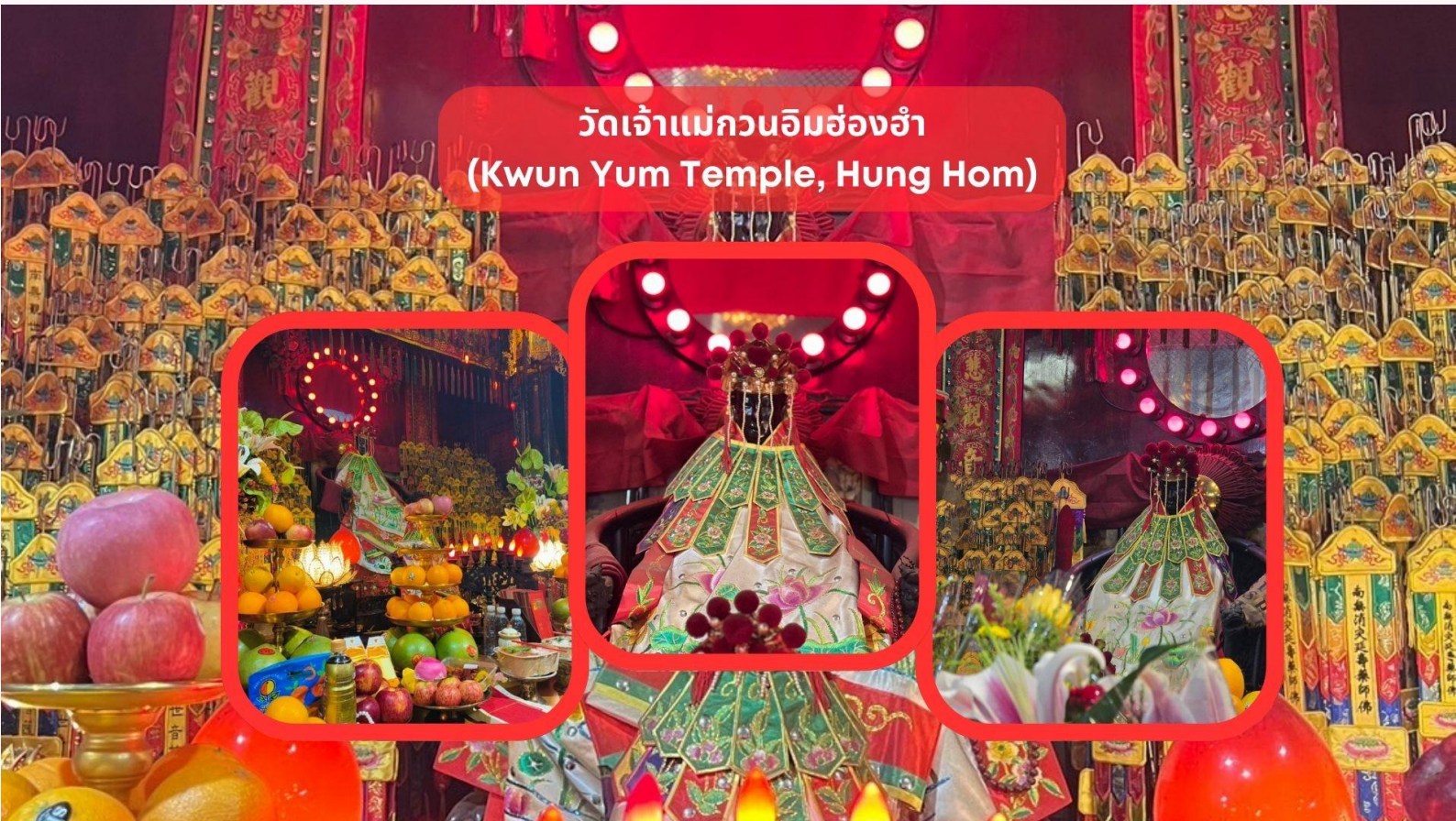
วัดเจ้าแม่กวนอิมฮ่องฮำ (Kwun Yum Temple, Hung Hom)

ฮ่องกง เมืองแห่งสีสันและวัฒนธรรมที่ไม่เคยหลับใหล เป็นเมืองที่เต็มไปด้วยพลังและชีวิตชีวา