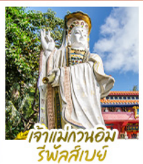
เจ้าแม่กวนอิม รีฟาส์เบีย