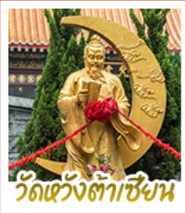
วัดเว้งต้าเซียน