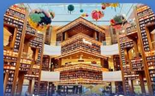
ต๋องกมุดคตาร์ทพีค