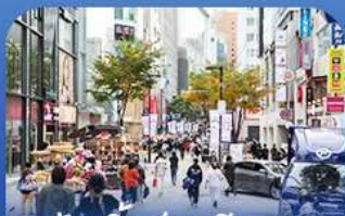
ช้อปบิงข่านเมียงดง