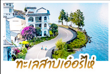
ทะเลสาบเอ๋อร์ไฮ่

นั่งรถม้าสุดฟิน ชมทุ่งข้าวสีทองเหลืองอร่าม • ถ่ายรูป MOOD ที่ใช้กับวิวทะเลสาบเอ๋อร์ไฮ่สุดโรแมนติก ชมดอกไม้ตามฤดูกาลกลางขุนเขา ณ สวนอวามู่ฉาง • พืชภูเขาที่ม้งกรหยกความสูงกว่า 4,506 เมตร (รวมกระเช้าใหญ่ ไป-กลับ) • นั่งรถไฟชมวิวภูเขาหิมะมังกรหยกวิวพาโนรามา • จิบกาแฟยามบ่าย พร้อมจิบช็อคอิน วิวหลักล้าน ณ ร้านกาแฟหยุนต้ออัน (รวมค่าเครื่องดื่มท่านละ 1 แก้ว) • เที่ยวเมืองโบราณต้าหลี่ ลี่เจียฟ ไปซา ชิม ซ้อป แชะ กับวัฒนธรรมยูนนาน • ช้อปปิ้งเพลิน ณ ถนนคนเดินหนานผิงเจียและ POP MART