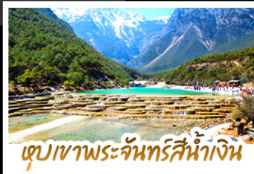
เขื่อนเขาพระจันทร์สีน้ำเงิน