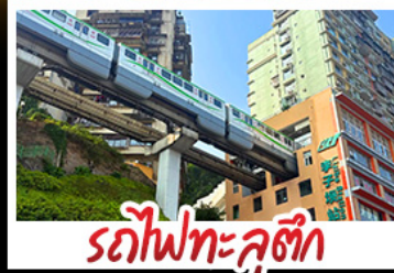
รถไฟทะลุคิ