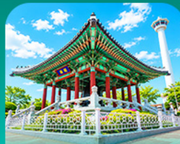
สวนแข่งดูซาน