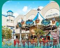
ลือตเต้ เจ้ากัซึต