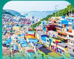
หมู่บ้านคิมซอน