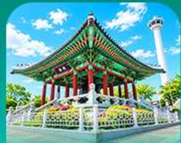
สวนพงดูซาน