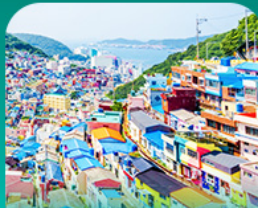
หมู่บ้านแดมเชอน