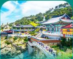
วัดแควดยงกุงซา

เที่ยวปูซานแบบแกรนด์ แกรนด์ ทั้งสายอาร์ก สายบู และสายช้อปปิ้ง • เช็กอินบนถ่ายรูปสุดคิลเลอร์ฟูล ที่ท่าเรือจินมิม (BUSAN BUNEZIA) เดินเล่นหมู่บ้านคิมซอน ซามโดร์มีแห่งปูซานสุดน่ารัก พลาดไม่ได้กับการนั่งรถไฟปูกิก ชมวิวทะเลเมืองปูซาน • เสริมสิริมงคลที่วัดแควดยงกุงซา วัดริมทะเลชื่อดัง พร้อมช้อปปิ้งที่ลือชื่อดังพรีเมียมอ่ากัซึต และตลาดบับโปดง ก่อนปิดท้ายด้วย ย่านวัยรุ่นสุดคูล ซอ มยอน อวโนว พร้อมชมวิวสะพาน ควังอันยามค่ำคืนสุดโรแมนติค