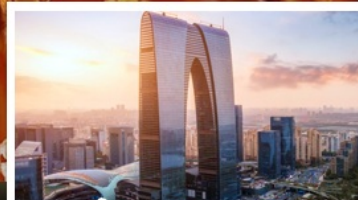
ประตูบูรพาทิศ