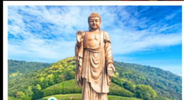
วัดพระใหญ่เฉิงชานต้าฝอ