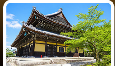
วัดนินเซ็นจิ