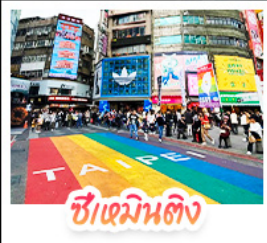
ซีเหมินดิง