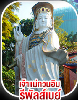
เจ้าแม่กวนอิม รีฟัลส์เบย์