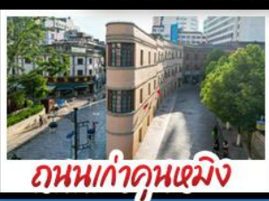
ถนนเก๋าคูหนิง