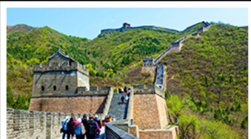
กำแพงเมืองจีนด่านจวิยงกวน