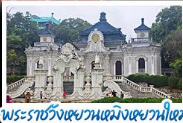
พระราชวังเซวานเหมิงเซวานไห้เหมิง