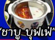
"ชาบู บุฟเฟ่"