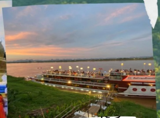
ล่องเรือแม่น้ำโขง