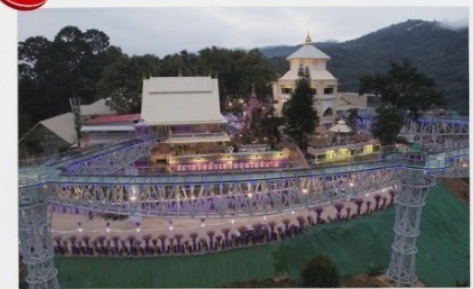
ศกยวอลค์

2 ท่านขึ้นไป 14,499 บาท/ท่าน 4 ท่านขึ้นไป 12,799 บาท/ท่าน 6 ท่านขึ้นไป