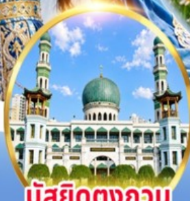
มัสยิดตงกอน