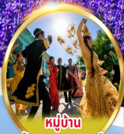
หมู่บ้าน วัฒนธรรมอุยกูร์