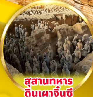
สุสานทหาร ดินเผาจีนซี