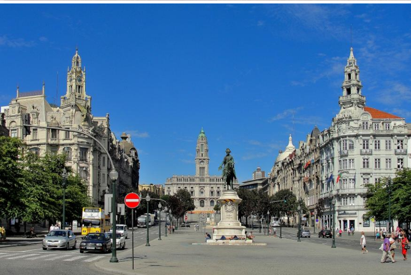
PRAÇA DA LIBERDADE