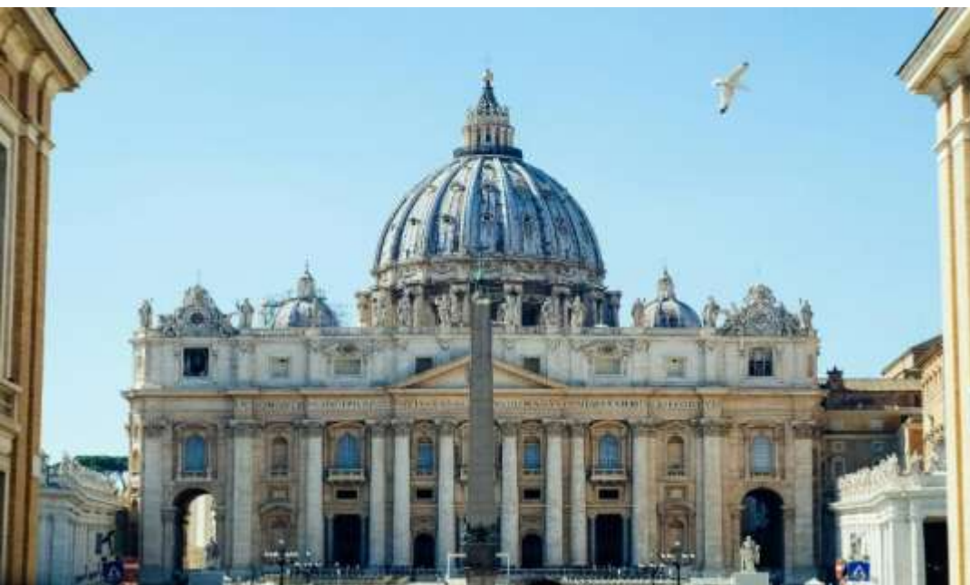
มหาวิหารนักบุญปีเตอร์ ( ST. PETER' BASILICA)

(กรณีมีพิธีด้านใน หรือถ้าหากมีผู้เข้าชมเป็นจำนวนมากจนไม่สามารถเข้าชมได้ทันเวลา ทั้งนี้เพื่อมิให้กระทบต่อกำหนดการท่องเที่ยวอื่นๆ ภายในโปรแกรมทัวร์" อาจจะไม่ได้รับการเข้าชม)