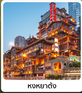
หงหยาดตั้ง

ไฮโล่! อุทยานแห่งชาติหลุมบ่อฟ้า มรดกโลกระดับ 5A รถไฟฟ้าทะลุตึก ตึกตะเกียบ อลังการแสงสีหงหยาดตั้ง