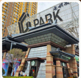
ห้าง G Park