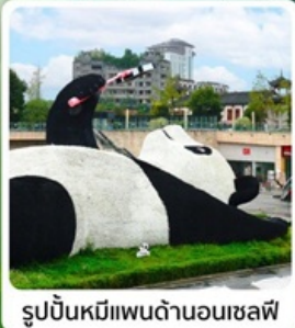
รูปปั้นหมีแพนด้าอนเซลฟี