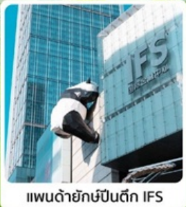
แพนด้ายักษ์ปีนตึก IFS