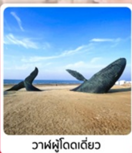
วาฬผู้โดดเดี่ยว