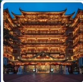
วัดต้าฝือซื่อ