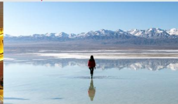
ทะเลสาบซิงไห่

*ทางบริษัทฯ ขอสงวนสิทธิ์ในการสลับโปรแกรมทัวร์ตามความเหมาะสมขึ้นอยู่กับสถานการณ์หน้างาน โดยคำนึงถึงผลประโยชน์ของลูกค้าเป็นสำคัญ