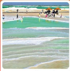
ทะเลสาบเกลือจาเอ้อฮาน