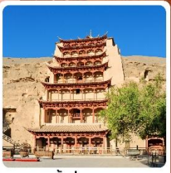
ถ้ำมั่วเกาตู