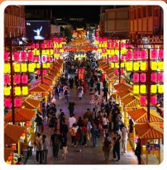
ตลาดกลางคีนซาโจว