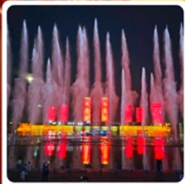
น้ำพุคังปาสือ