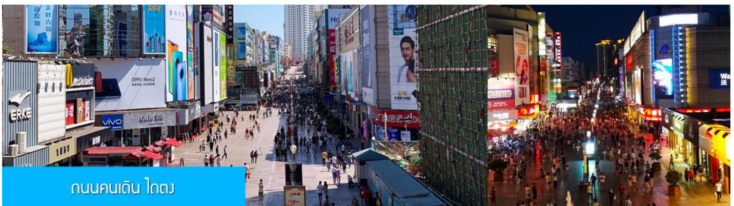
ถนนคนเดิน ไถตง

จากนั้นนำท่านเที่ยวชม โรงเบียร์ชิงเต่า 青岛啤酒博物馆 พิพิธภัณฑ์เบียร์ที่ขึ้นชื่อของเมืองชิงเต่า ซึ่งเป็นเบียร์ยี่ห้อแรกที่ผลิตขึ้นในประเทศจีน ชมเบียร์ คอลเลกชันที่มียี่ห้อหลากหลายที่สุดของโลก และชมการจัดแสดงภาพและวิดิทัศน์เกี่ยวกับวิวัฒนาการของเบียร์ ขั้นตอนการผลิตและอื่น ๆ ที่เกี่ยวข้อง พร้อมชิมเบียร์ชิงเต่า ซึ่งเป็นเบียร์ที่ขายดีที่สุดในหนึ่งของจีน.. (ชิมเบียร์ชิงเต่าท่านละ 1 แก้ว รับประทานอีก 1 ขวดเล็ก ตอนเดินออก)