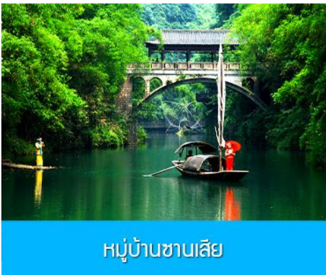
หมู่บ้านชานเสี๋ย

พักที่ YICHANG HUIHAO HOTEL โรงแรมระดับ 4 ดาวหรือเทียบเท่าในเมืองหยีซาง