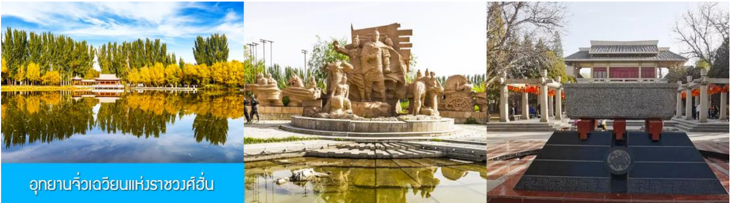
อุทยานจิวเฉวียนแห่งราชวงศ์ฮั่น

จากนั้นนำท่านเดินทางสู่เมืองจิวเฉวียน (ระยะทาง 50 กม. ใช้เวลาเดินทาง 1 ชั่วโมง)