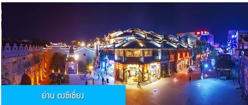
ย่าน ตงซีเซียง

จากนั้นนำท่านเที่ยวชม พิพิธภัณฑ์ดอกกุยฮวา 桂花公社 ดอกกุยฮวาเป็นดอกไม้สีเหลืองที่มีกลิ่นหอม เป็นดอกไม้ประจำเมืองของกุยหลิน จะเบ่งบานในช่วงเดือนมิถุนายน – กรกฎาคมของทุกปี ในช่วงที่ดอกกุยฮวาเบ่งบานในเมืองกุยหลินจะคลุ้งไปด้วยกลิ่นหอมจากดอกกุยฮวา ทั่วเมืองกุยหลินจะเต็มไปด้วยสีเหลืองของดอกกุยฮวา ดอกกุยฮวาสามารถนำมาแปรรูปเป็นอาหารและเครื่องดื่มได้ และได้รับความนิยมจากชาวจีนตอนใต้เป็นอย่างมาก ชมพิพิธภัณฑ์ที่ทันสมัยด้วยระบบจัดแสดงที่ทันสมัย ภายในพิพิธภัณฑ์มีความโอ่อ่า มีการสาธิตและจำหน่ายผลิตภัณฑ์ที่ทำจากดอกกุยฮวา อาทิ ขนมดอกกุยฮวา ชาที่ทำจากดอกกุยฮวา และสินค้าพื้นเมืองอื่น ๆ