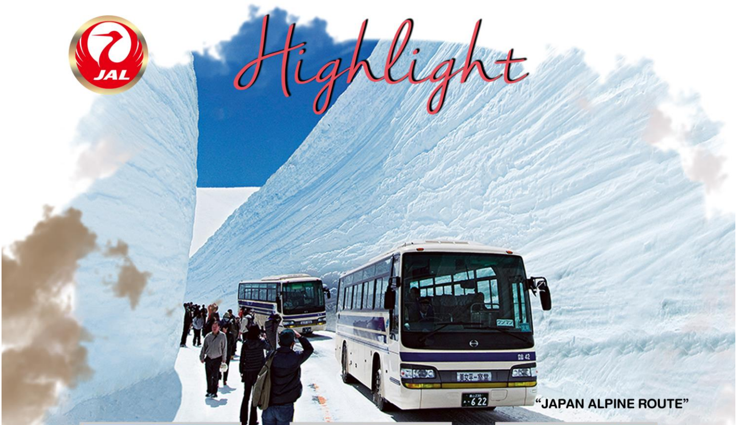
“JAPAN ALPINE ROUTE”