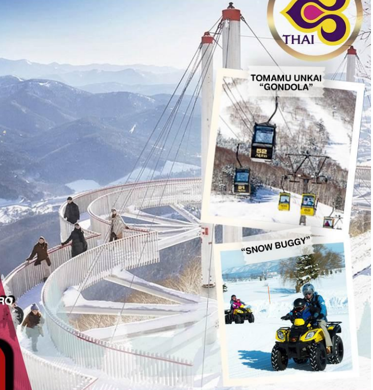
TOMAMU UNKAI “GONDOLA”