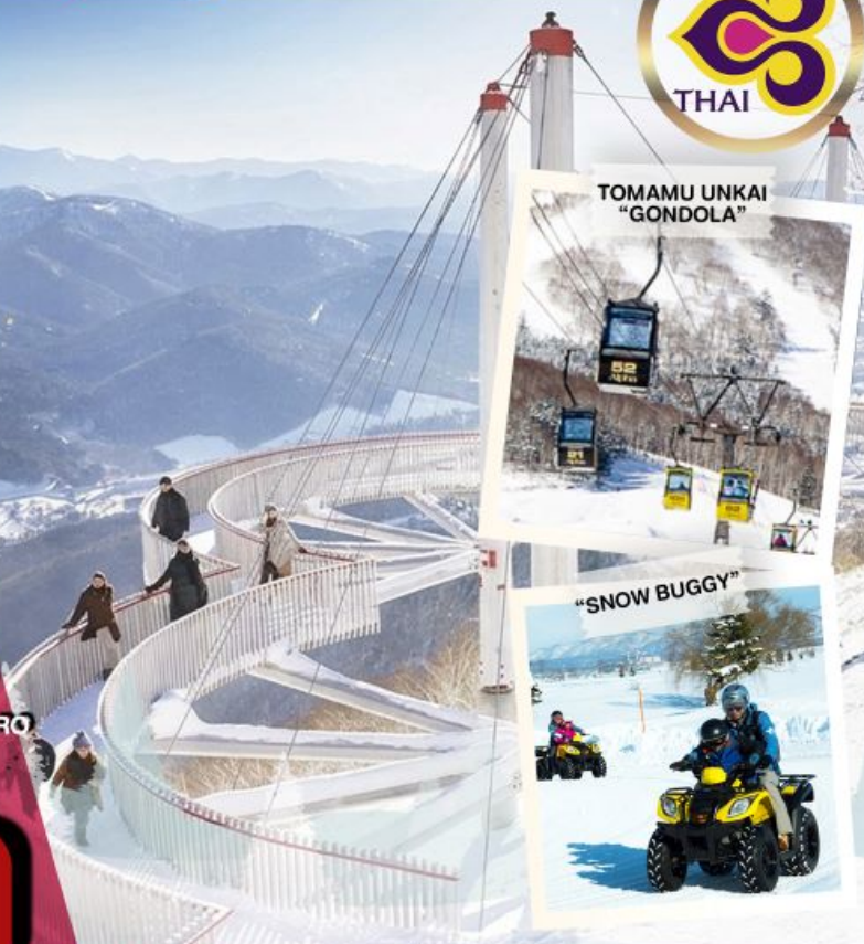
TOMAMU UNKAI "GONDOLA"