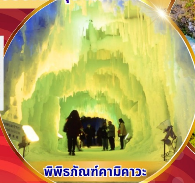
พิพิธภัณฑ์คามิดาวะ