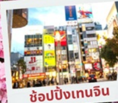
ช้อปปิ้งเทนจิน