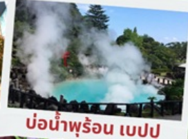
บ่อน้ำพุร้อน เปรปุ

หมู่บ้านยูฟูอินฟลอร์ริล ทะเลสาบคินริน ทะเลสาปคินริน บ่อน้ำพุร้อน อุมิจิโกกุ ท่าเรือโมจิโกะ เรโร ตลาดปลาอาราโตะ ศาลเจ้ามียาจิดาเกะ ดิวตี้ฟรี ฟุกุโอกะ เบย์ พลาซ่า ช้อปปิ้งออน มอลล์ หิ้งคูเมโอโตะอิวะ ชมดอกไม้ไฮเดรนเยีย รอนน้ำตกชิราอิโตะ ช้อปปิ้งย่านเท็นจิน