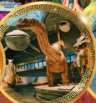
พิพิธภัณฑ์ธรรมชาติเซี่ยงไฮ้