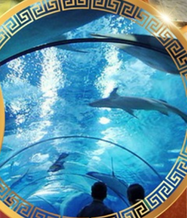
เซี่ยงไฮ้อาเซียนอะควาเรียม