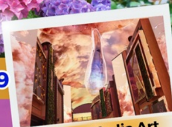
Aurora Media Art