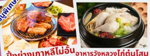
ปิ้งย่างเกาหลีไม่อื่น อาหารวังหลวงไก่ตุ๋นโสม